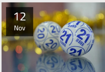
BINGO von 14 - ca. 17 Uhr

Veranstaltungen besuchen, deren Erlöse in die „Renovierungskasse“ fließen: