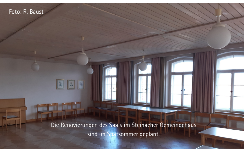
Die Renovierungen des Saals im Steinacher Gemeindehaus sind im Spätsommer geplant.