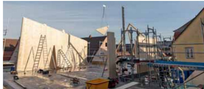
Die Wände im Neubau werden errichtet.

Verfügung, um alle Facetten des Streuobstes abzubilden. Die einzelnen Räume umfassen die Themen Lebensraum Baumstamm, Baumkrone, Krautschicht und Boden, sowie Baumpflege, Vielfalt der Obstsorten und Geschichte des Streuobstanbaus. Weiterhin wurden die Gewerke Trockenbauarbeiten, Fliesenarbeiten, Dämm-, Putz- und Malerarbeiten, Heizungsinstallation, Elektrotechnik, Klimatechnik, Ausstattung Mosterei und Innentüren Neubau vergeben. Regelmäßige Informationen über den Baufortschritt am Bernatura finden Sie im Online-Bautagebuch unter https://www.burgbernheim.de/Startseite/aktuelle-Projekte/Bernatura/Bernatura-Bautagebuch/K901.htm .