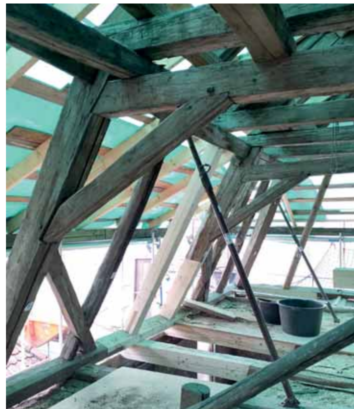
Die Dachkonstruktion im Marktplatz 6 wird ertüchtigt.