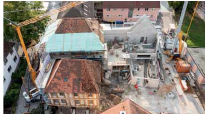
Stand der Bauarbeiten am 12.09.2023.

Die laufende Baumaßnahme Bernatura geht weiterhin gut voran. Im September und Oktober wurde mit den Sanierungsarbeiten des Daches von Marktplatz 6 begonnen. Etliche Balken müssen ausgewechselt oder repariert werden. An beiden Bestandsgebäuden wurde die Fassade freigelegt und das Fachwerk auf seinen Zustand untersucht. Am Weberhaus wurden das Sockelfundament an der Ostfassade und die Unterfangung neu hergestellt. Am Neubau haben die Holzbauarbeiten begonnen. Die Decke über der Mosterei wurde eingebaut. Das weitere Geschoss wird in Holzständerbauweise mit im Werk vorgefertigten Modulen errichtet. Bis Anfang November wird dann auch der Dachstuhl errichtet sein. Aus diesem Anlass feiert die Stadt am 12.11.2023 ein Richtfest. In der Stadtratssitzung vom 12.10.2023 wurde das Ausstellungskonzept von den Fachplanerinnen vorgestellt. Im Obergeschoss des ehemaligen Schleckermarktes stehen insgesamt 110 m 2 zur